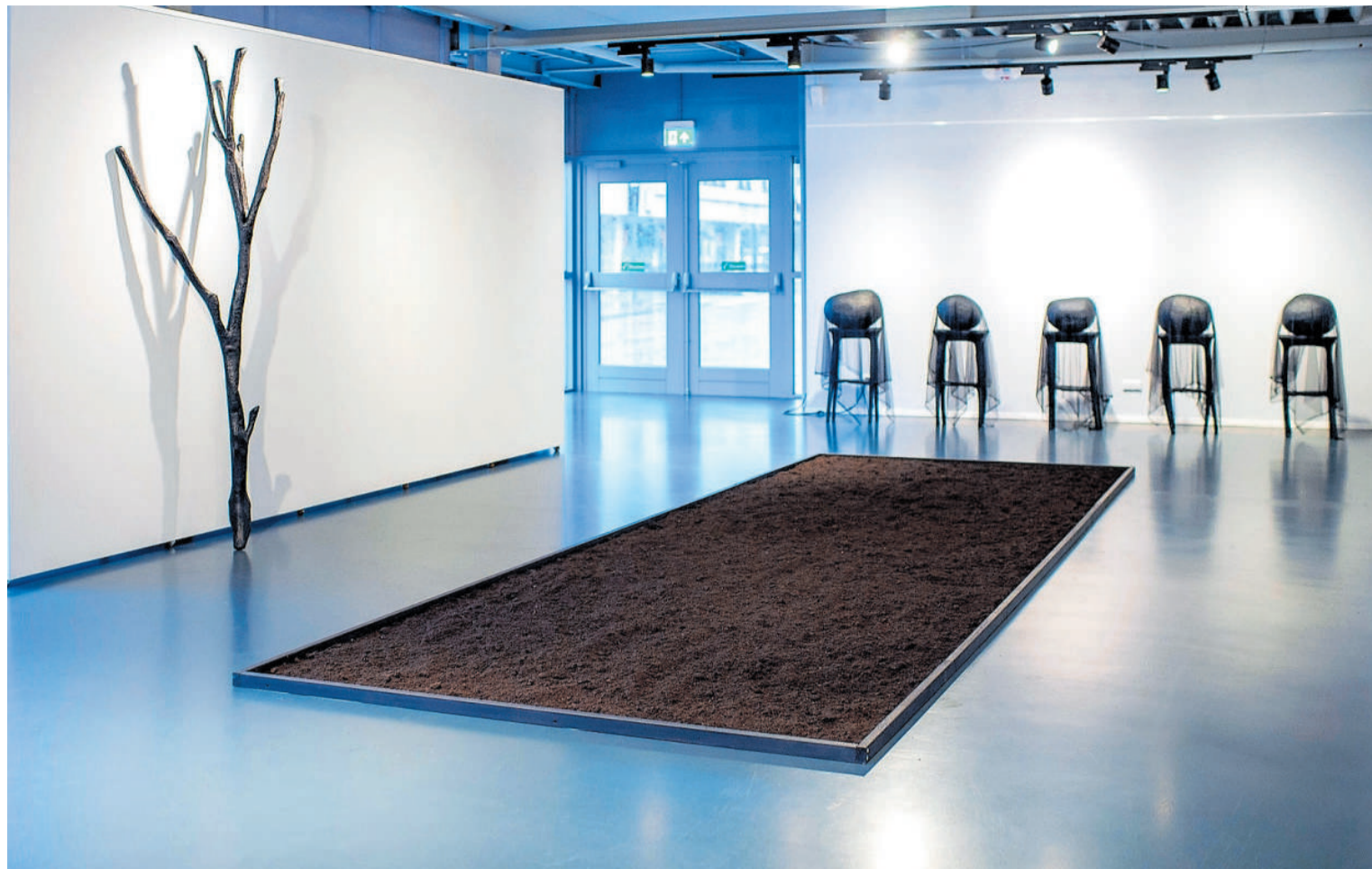
Janke Klompmaker geeft haar eigen visie op zowel de zichtbare als voelbare wereld.